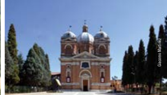
Basilica della Beata Vergine del Castello di Fiorano